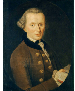
Immanuel Kant

Vielleicht hast du nicht viel mit Philosophie zu tun, aber das Kommende wirst du wahrscheinlich nachvollziehen können: Eine zentrale Frage der Philosophie ist; „Was kann ich wissen?“. Um diese Frage zu beantworten hat sich der Philosoph Immanuel Kant mit der Erkenntnistheorie auseinandergesetzt. Mithilfe der Erkenntnistheorie wollen wir dir zeigen, wie du Nachrichten auf Social Media besser einordnen kannst.